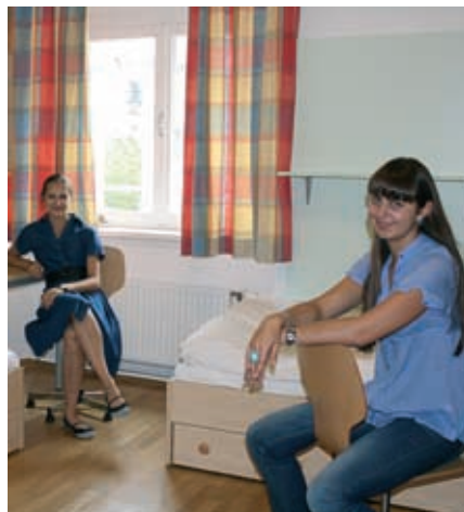
Freundliche und komfortable Zimmer.

Einen Konzert- oder Musicalabend solltet ihr euch in der Kulturstadt Wien nicht entgehen lassen.