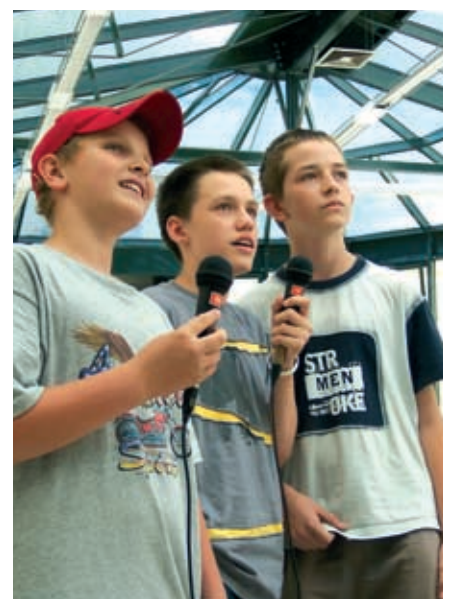
Karaoke: Jeder ist ein Star.