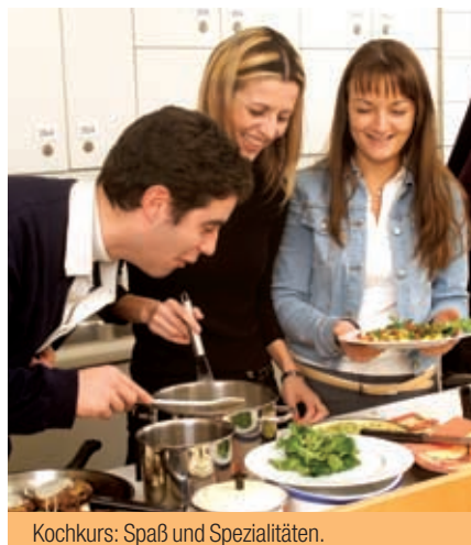
Kochkurs: Spaß und Spezialitäten.

Die Kosten für jeden Tagesausflug sind direkt in Wien zu bezahlen (=Selbstkostenpreis).