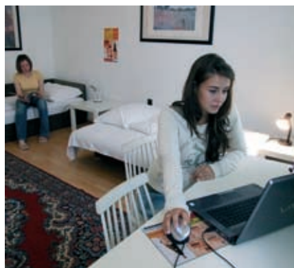
Gratis W-LAN in der ActiLingua Residenz.

Ausstattung: Ein- oder Zweibettzimmer mit gemeinsamem Bad. Die meisten Wohnungen haben auch eine eigene Waschmaschine sowie einen Fernseher oder ein Radio.