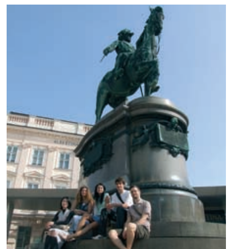
Stadtspaziergang: Information und Spaß.

Wenn Sie Ihren Kurs regelmäßig (mind. 80%) besucht haben, erhalten Sie ein Teilnahmezertifikat, das über Art des Kurses, Dauer, Kursstufe, Anzahl der Lektionen sowie Lernziele Auskunft gibt.