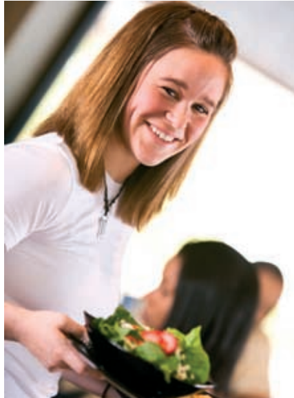
Praktikum im Hotel.