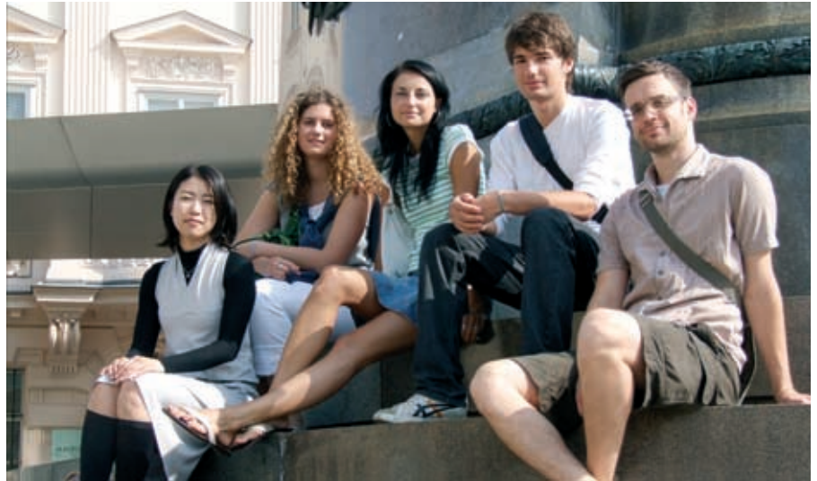
Wien erleben bei geführten Stadtspaziergängen.