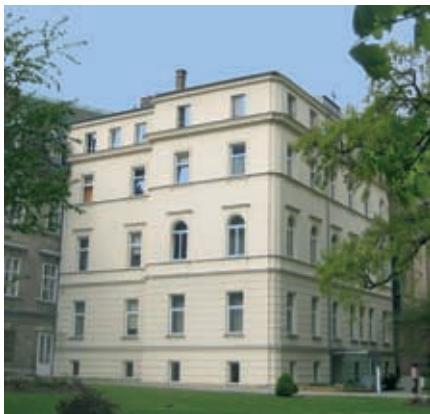
Ferienkurs im Sacré Coeur.