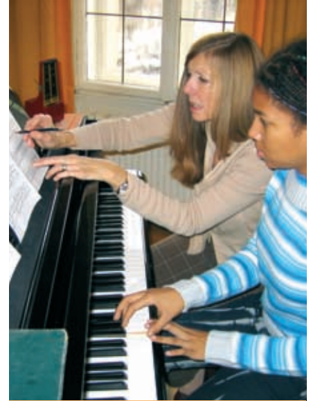
Deutsch und Musik.

Alle Deutschkurse (auch die Spezialkurse) mit einer Dauer von 12 oder mehr Wochen sind mit bis zu 30 % deutlich preisreduziert! Der Rabatt ist in der Preisliste bereits berücksichtigt.