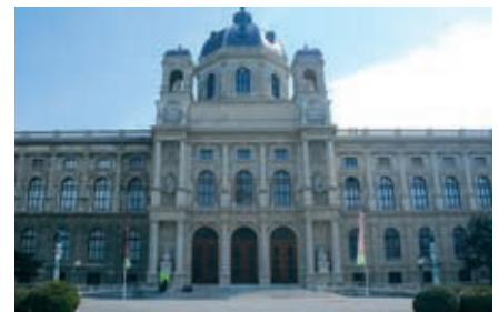
Das Kunsthistorische Museum am Ring.

Sie haben sich die Grundzüge der Sprache angeeignet und üben das Lesen, Schreiben und mündliche Erörtern schwieriger Themen in einem komplexen Umfeld.