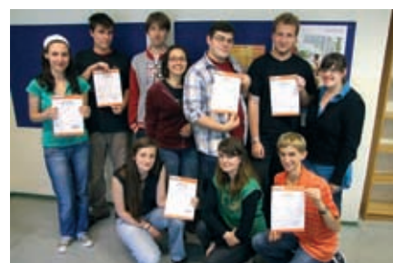
Jeder erhält sein ActiLingua-Zertifikat.

Musical, Konzert: Ein Konzert- oder Musicalabend gehört in der Kulturstadt Wien einfach dazu.