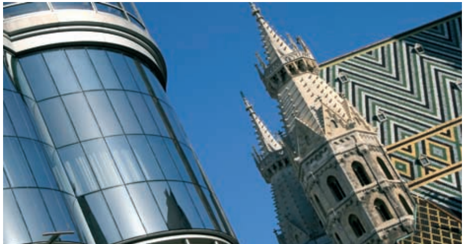
Haas-Haus und Stephansdom: Moderne und Tradition in Wien.

Sie haben Vorkenntnisse der Sprache und lernen, sich in vertrauten Alltags-