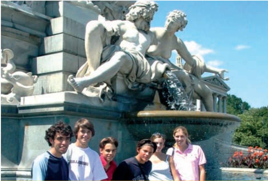
Stadtbesuch und Sightseeing: Das Parlament an der Ringstraße.