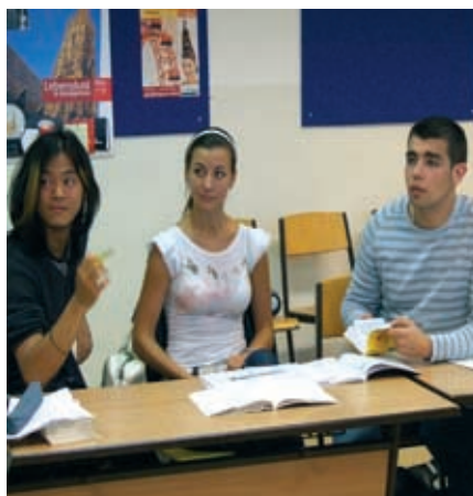
Deutsch lernen mit Freunden.