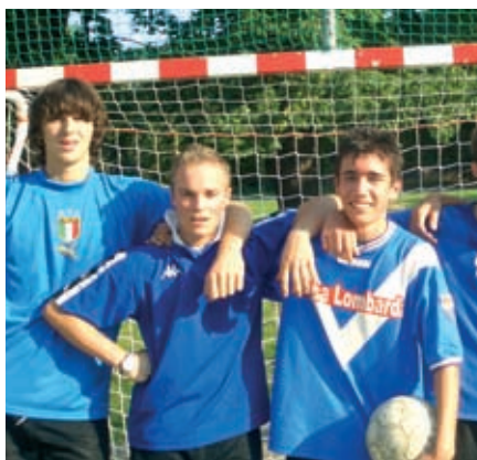
Fußballturnier im Schulpark.

Abendessen: fast immer warme Speisen, außer nach manchen Ausflügen; manchmal Grillabende.