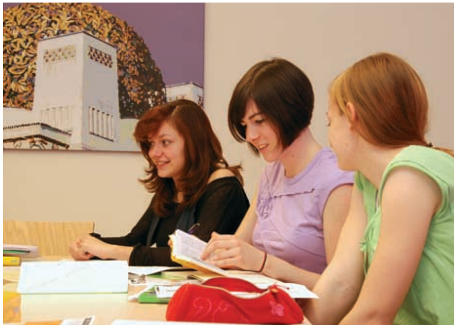
Lernen in kleinen Gruppen garantiert Erfolg.

Kombination aus Gruppenunterricht (Standardkurs) und Einzelstunden. Der