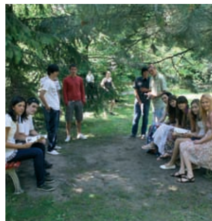
Pause im Park des Sacré Coeur.