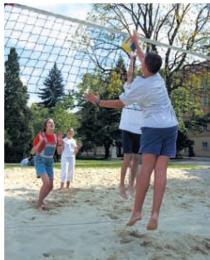
Beachvolleyball am Campus.