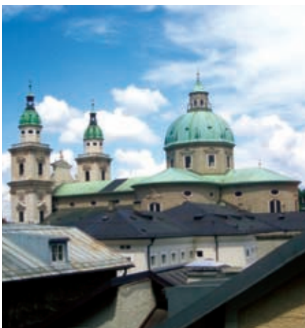
Exkursion zur Mozartstadt Salzburg.

Am Wochenende rufen Kultur und Natur. Wir organisieren Ausflüge in die Mozartstadt Salzburg, die steirische Hauptstadt Graz, die Babenbergerstadt Klosterneuburg oder in das berühmte Donautal, die „Wachau“. Im Sommer fahren wir zum