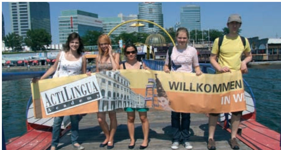
Willkommen zum Deutschkurs in Wien.