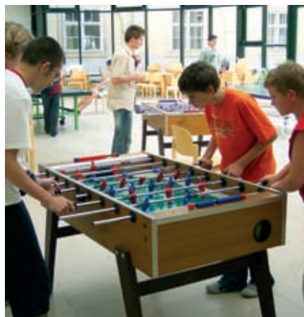
Betreute Freizeit: Tischfußball.