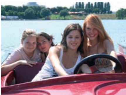
Freizeitspaß auf der Donauinsel.

Prüfungskurs: ÖSD-Zertifikat Deutsch für Jugendliche: 6 Lektionen Prüfungsvorbereitung zusätzlich zu Ferienkurs 1/2.