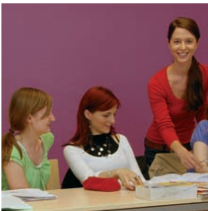
Motivierte, qualifizierte Lehrer.

Deutschlehrerkurs-Intensiv: 35 pro Woche: allgemeiner Deutschkurs (20) + Einzelunterricht (10) + Kulturprogramm (5).