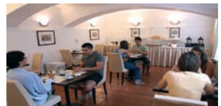
Frühstücksbüffet in der ActiLingua Residenz.

Ausstattung: Einzel- oder Doppelzimmer. Die meisten Zimmer sind mit Dusche, WC und Telefon ausgestattet.