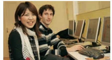
Gratis W-LAN in der ganzen Schule.

Kombinieren Sie Ihren Deutschkurs mit einem Schitag am Wochenende! Fordern Sie unser detailliertes Programm an.