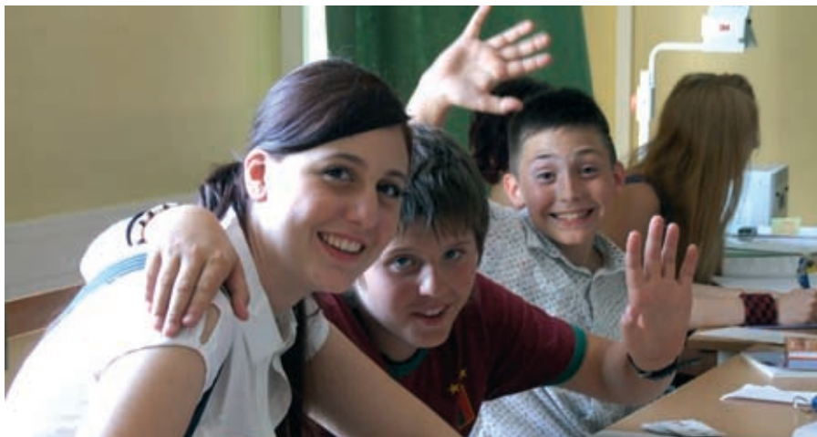
Sommer in Wien: aktiv, lehrreich, spannend und unvergesslich.